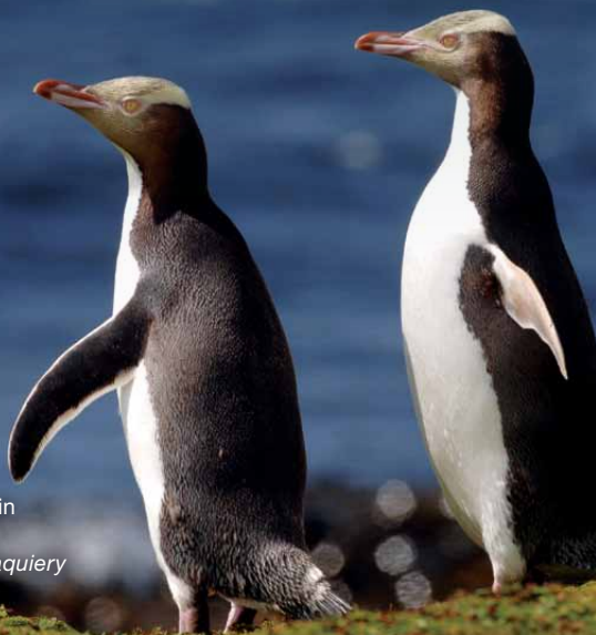
Gelbaugenpinguin (Māori: Hoiho)

Allen Inseln wurde die höchste Schutzstufe zugewiesen: „National Nature Reserve“ (nationales Naturschutzgebiet). Zusätzlich wurden sie 1998 aufgrund ihrer einzigartigen und vielfältigen Flora und Fauna von der UNESCO zum Weltnaturerbe erklärt.