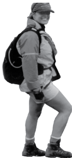
Seien sie bereit für jedes Wetter

Folgen Sie vom Red Crater aus den markierten Weg, der zum Gipfel führt. Rechnen Sie mit 1 ½ bis 2 Stunden für den Hin- und Rückweg.